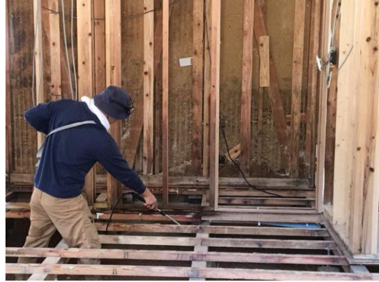
家屋内消毒活動も実施