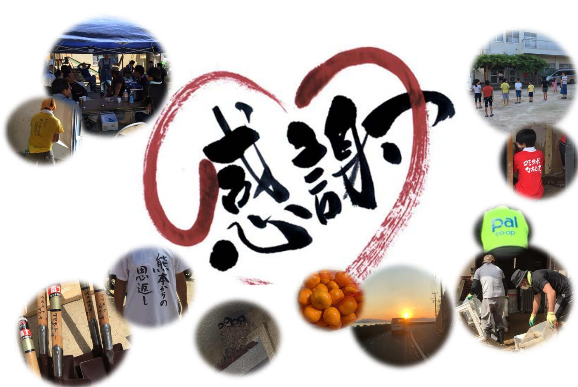
コミサポひろしま の活動は多くの皆様の支援に支えられています。ありがとうございます。