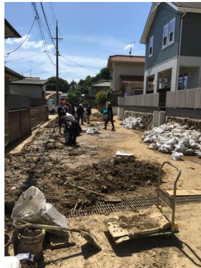
これまでの経験を活かし、 各地からの支援物資の手配を実施