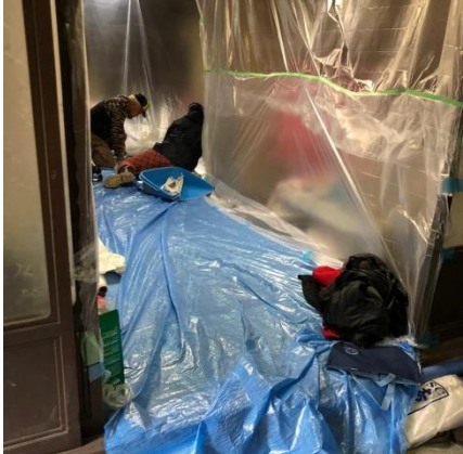
半年以上放置された床下はカビだらけ