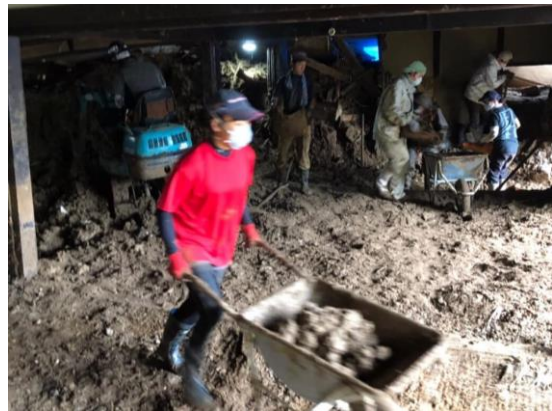
4 か月経っても手つかずの家屋