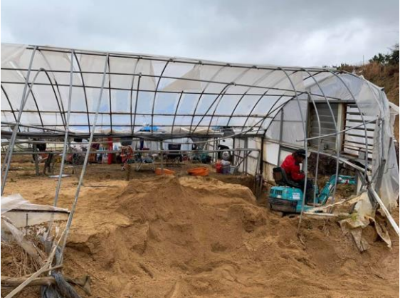
大量の土砂で破壊されたハウス