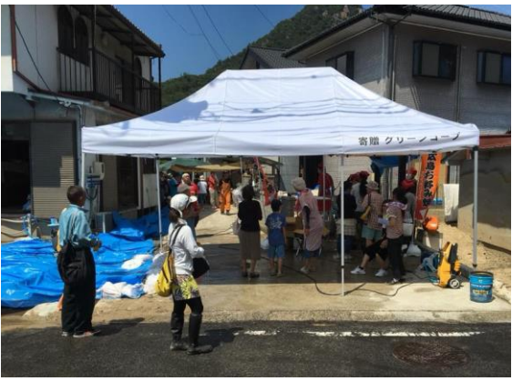
地域で炊き出しの支援の調整