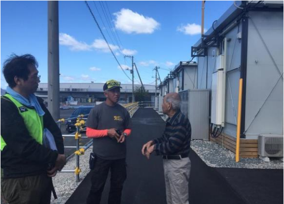
仮設住宅訪問と聞き取り