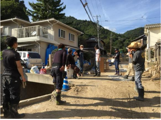
炎天下の中、続く大量の土砂・ガレキ撤去