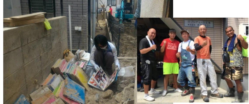
様々な方の支援 (写真はプロレスラーの皆さん)