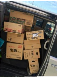
小規模避難所 へ食糧支援 ※吉浦、天応