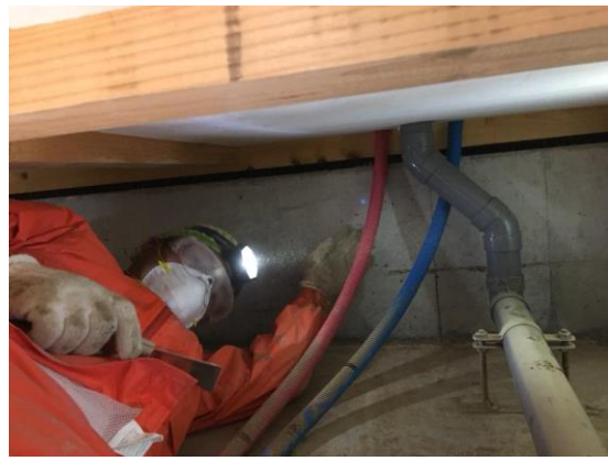
床下に潜っての活動