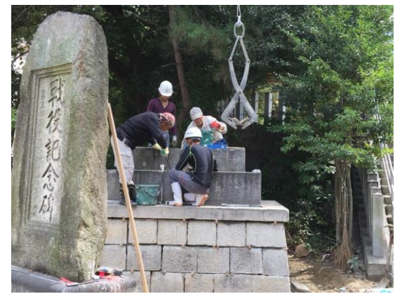
業者と協働で記念碑の修復